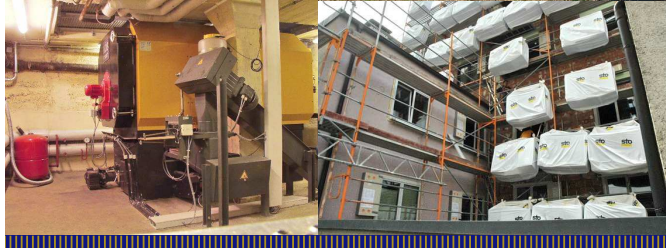
Energiekonzept - Best Western Premier Hotel Victoria