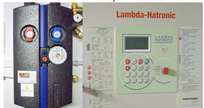
Pumpe und <Solarstation> Regelung des Heizkessels

Ganzjährig geöffnet. Wir sind 2 Bewohner, die ganzjährig das Haupthaus neben der Hütte bewohnen. Die Ferien-Hütte kann 4 Personen beherbergen.