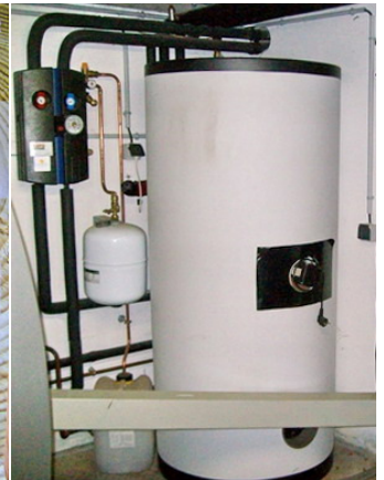
der Wärmespeicher rechts vom Heizkessel