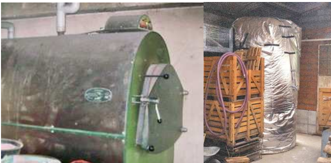
la chaudière à bois et le ballon

Le bois fournit toute l'énergie pour chauffer les bâtiments (460 m 2 ) par une chaudière bois bûche (modèle Herlt). La puissance maximum est 65kW. La consommation annuelle est de 30 stères (bois). Un grand ballon de 9000 litres installé en 2004, qui a une isolation de 25 cm, peut stocker la chaleur de la chaudière bois pour quelques jours.