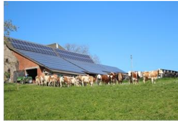
PV auf landwirtschaftlich genutzten Gebäuden