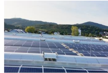
PV auf Gewerbedächern