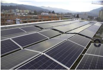
Photovoltaik (PV) auf Mehrfamilienhäusern