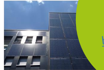
Sonderlösungen mit PV, z.B. in der Fassade

Steigerung der Zubaurate an neu installierten PV-Anlagen um 4MWP/a