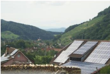
PV auf Einfamilienhäusern

Steigerung der Zubaurate an neu installierten PV-Anlagen um 4MWP/a