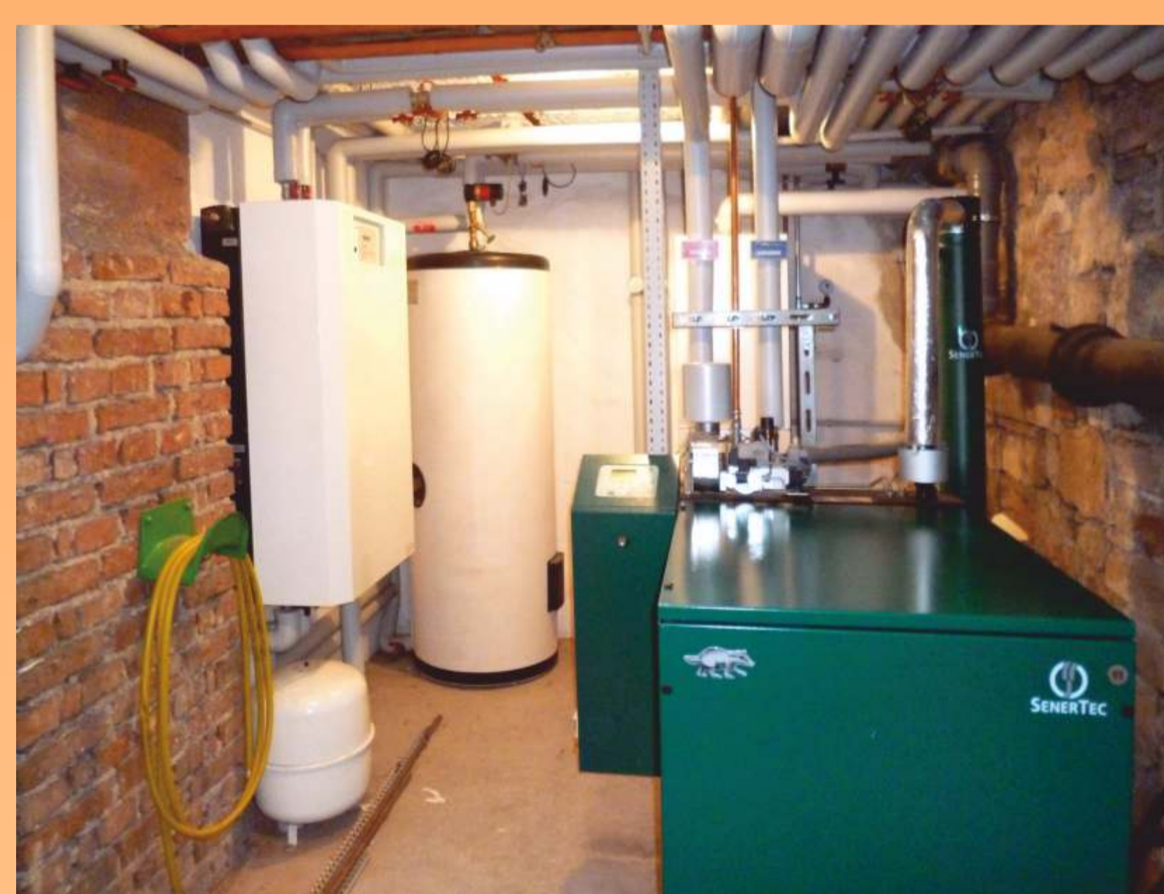
BHKW mit Spitzen-Therme