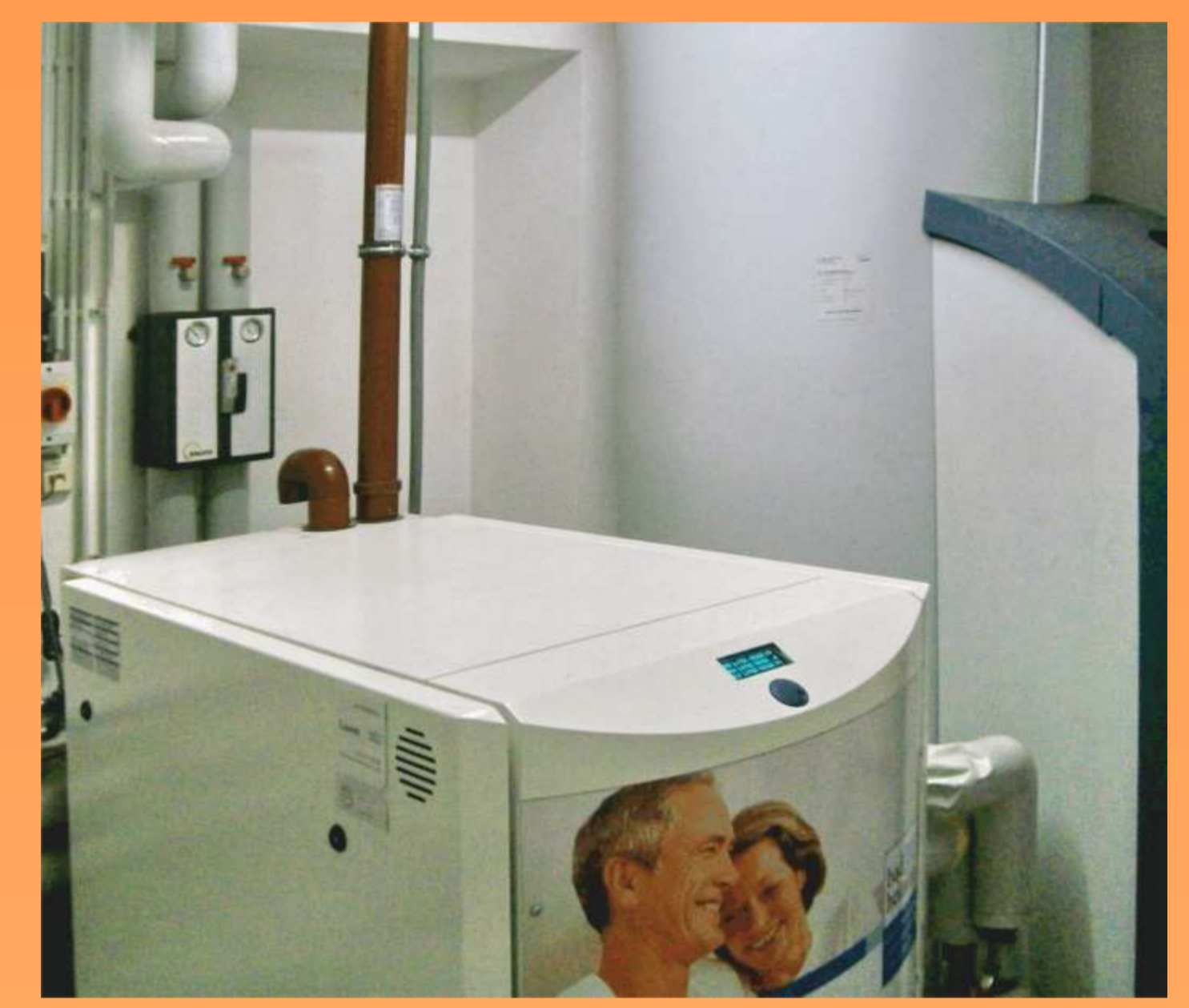
Mini-BHKW mit Speicher und Spitzentherme