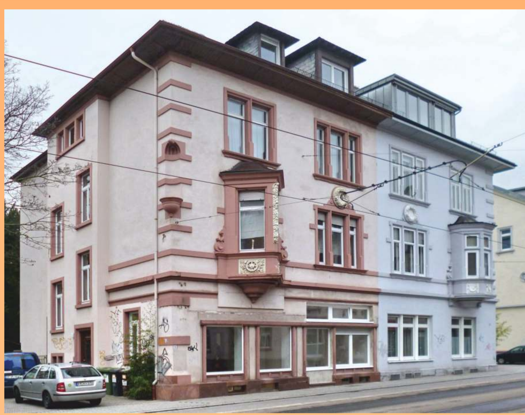
Vermieter von DH-Altbau ersetzt viele Heizungen durch Mini-BHKW