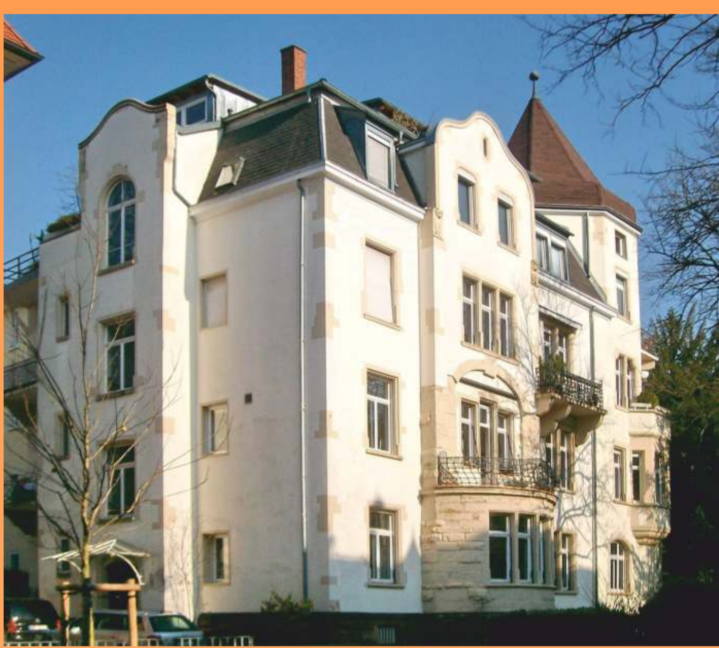
WEG mit Mini-BHKW statt Etagenheizungen

Mini-BHKW*: Die „eierlegende Wollmilchsau“ für Ihre EnergieWende im Heizungskeller!