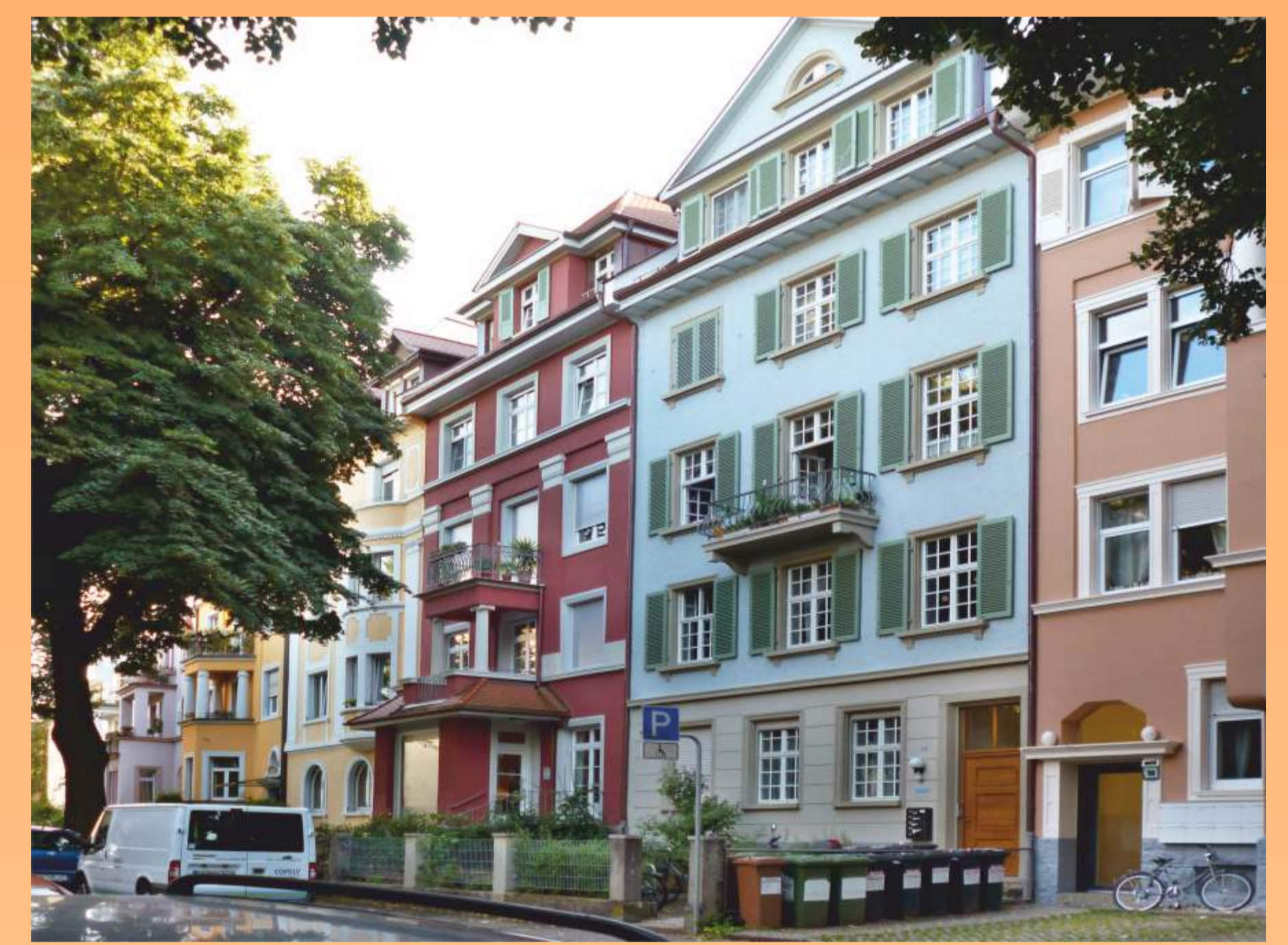
nur 12.500 € Mehrkosten (netto) für Mini-BHKW in Doppel-MFH

optimal: Eigenstrom gemeinsam erzeugen und nutzen