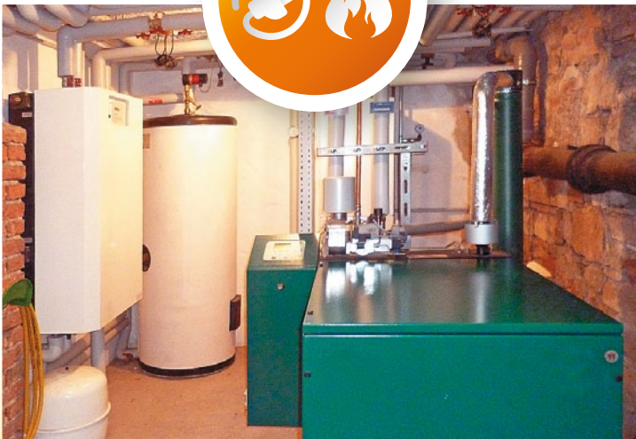
Vermieter und Mieter betreiben dieses Mini-BHKW in Freiburg-Wiehre gemeinsam zur Eigenstromerzeugung. Vorn das BHKW mit Brennwertnutzung, seitlich Wärmespeicher und Hilfseinrichtungen.

BHKW können sogar Etagenheizungen ersetzen und auch vorhandene Heizanlagen vorteilhaft ergänzen.