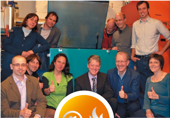
Expertenrunde: Das Projektteam von Kraftwerk Wiehre

„Ich möchte meine Energierechnung senken, etwas für die Umwelt und unsere Zukunft tun“, denken viele zu Recht. Doch wie geht die Energiewende zu Hause, im Stadtteil? Umstellen auf Strom erzeugende Heizungen (Mini-BHKW) ist das Mittel! Bestehende Freiburger Vorbilder sollten die Regel werden!