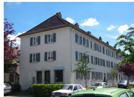
Zunftstr. 13-15 bis 21