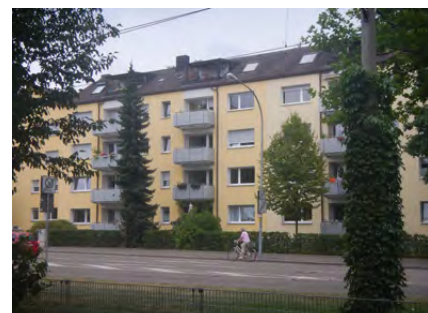
Fehrenbachallee, Dach bereits ausgebaut.