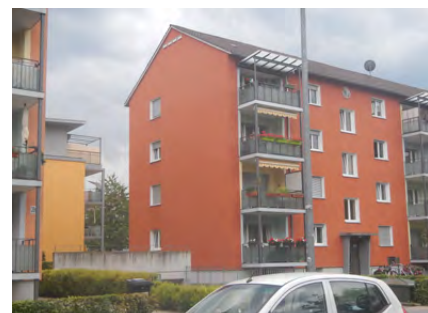
Fehrenbachallee, Dach ausbaubar.