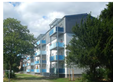
Bezahlbare Mieten: Aufstockung Belchenstr.