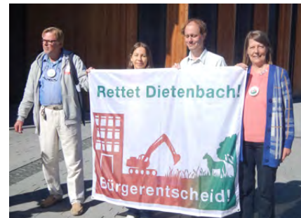
Fotos: Logo Bürgerentscheid, Dietenbachgebiet, Demonstration gegen den Neubaustadtteil, Pressegespräch zum Start Bürgerbegehren, Übergabe erste Unterschriften an Stadt.